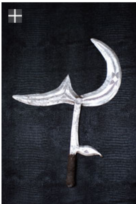
NGBAKA - Gbaya Za 1900 Congo R.D.C.