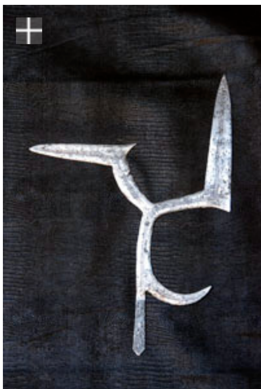
MBANJA ONDO / Congo RDC 1920