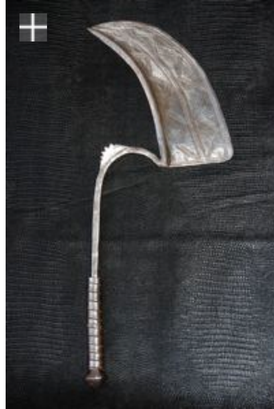
Dadyla Tula femelle 1940 Nigéria