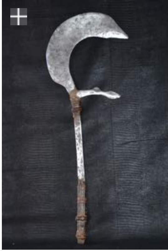
Couteau de jet Nuba