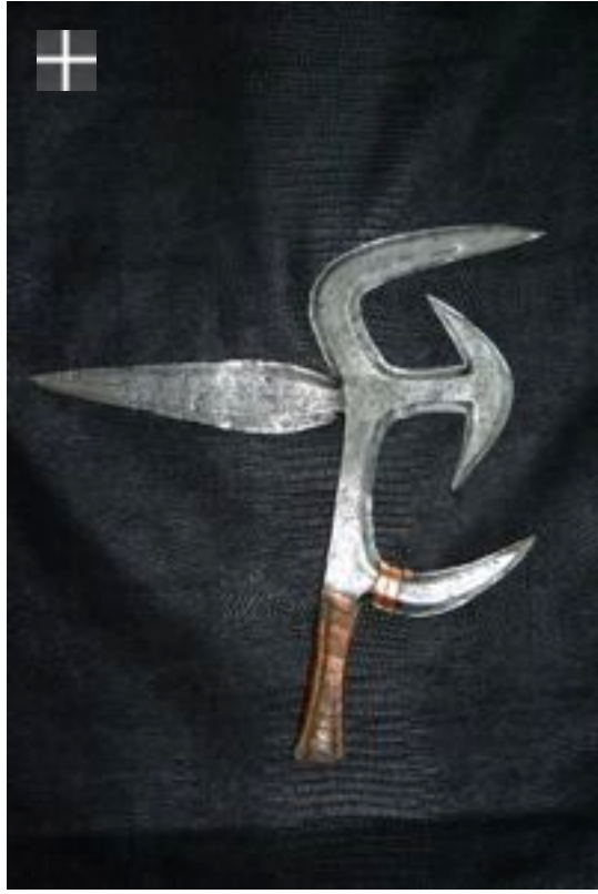
NGBAKA - MABO 1900/1930 Congo R.D.C.