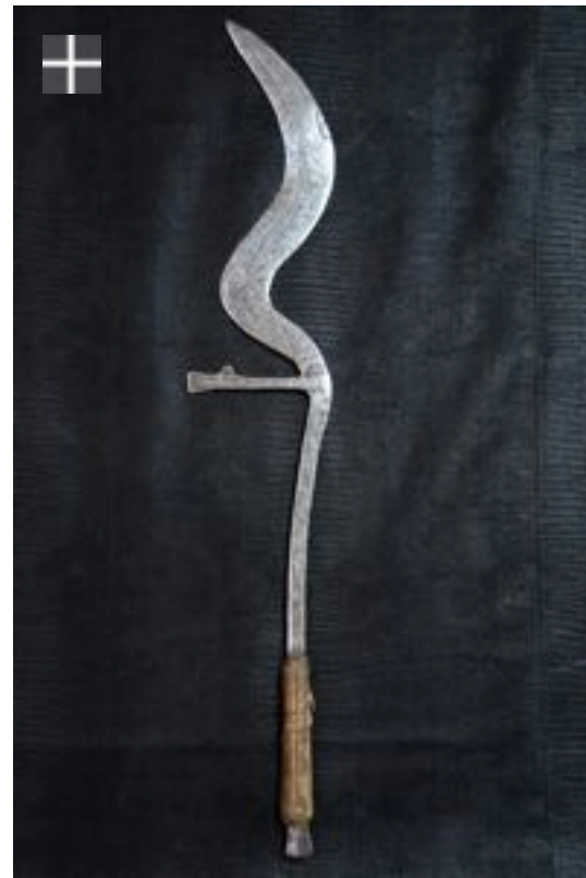
Ingessana "Sai" Serpent