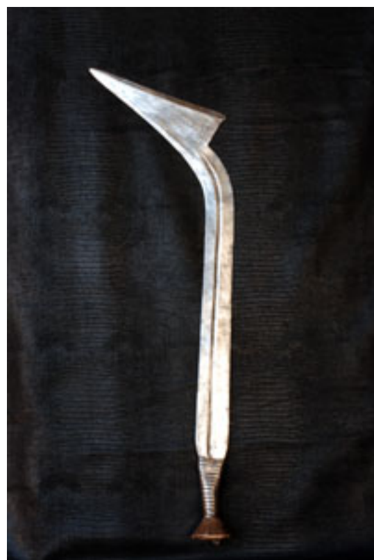
NGOMBE-Doko Avant 1940 / Zaïre