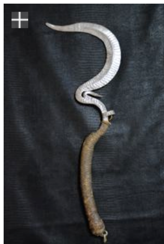
Matakam-Paduko Sengésé Nigéria