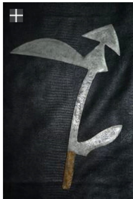
Kreich RCA Soudan