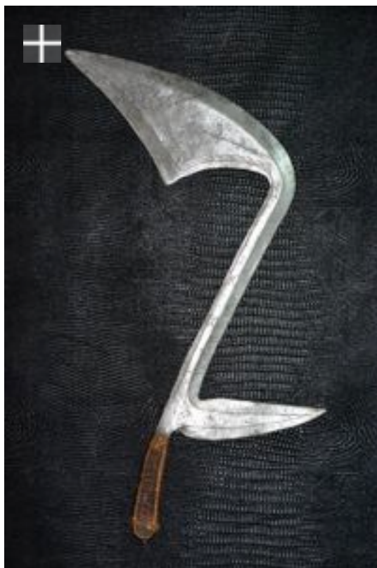
Banda RDC. 1900