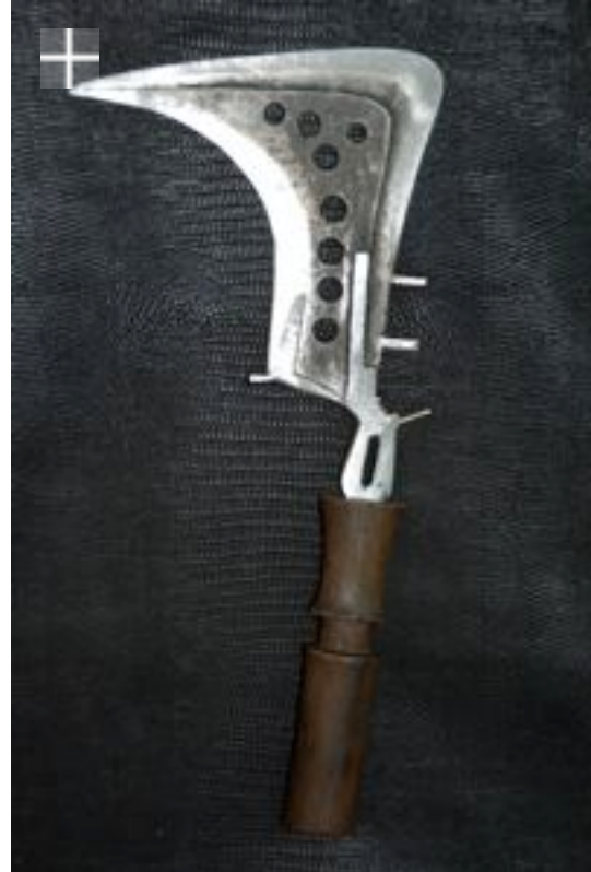
Mangbetu Trumbash 1900-1920