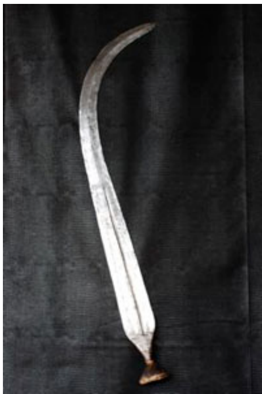
NGOMBE DOKO 1930 / Congo