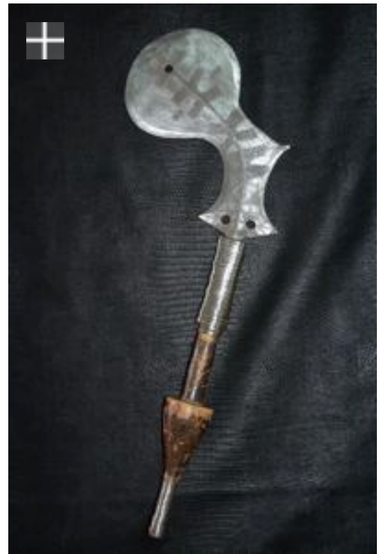
Couteau Momvu 1900