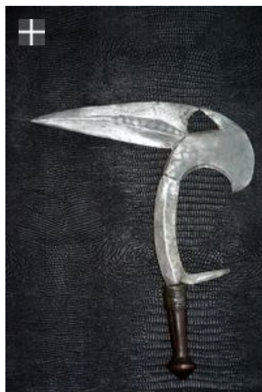
Kota Calao du sud Gabon