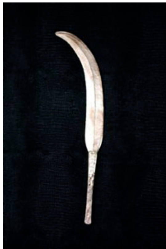
YAKOMA RDC Zaïre 1930