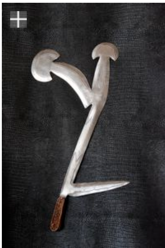
TOGBO-Banda 1900 RCA