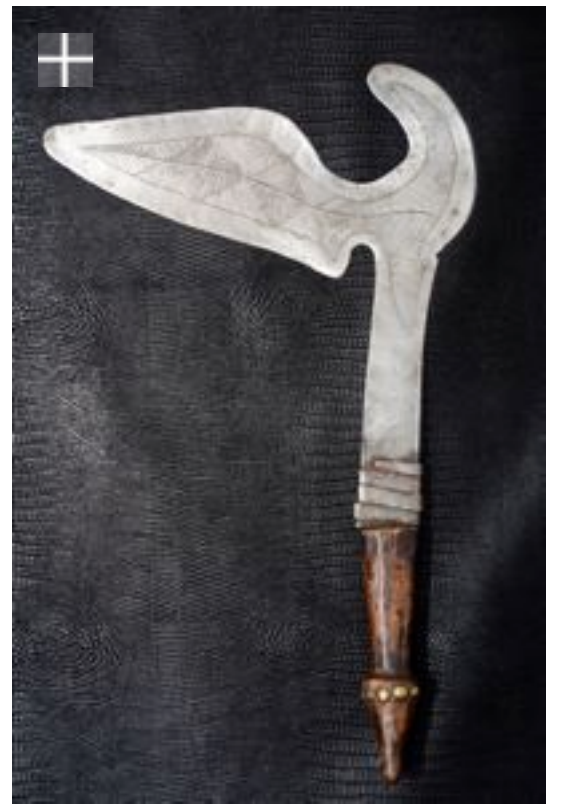
DJEM-BUMALI Gabon Congo Brazza