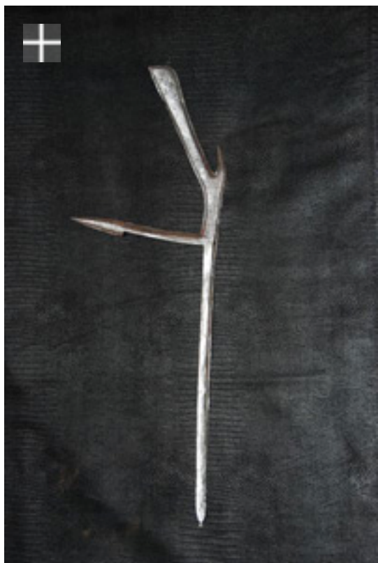
LAKA Tchad 1880