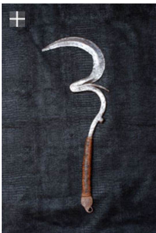
MATAKAM Sengésé / Cameroun