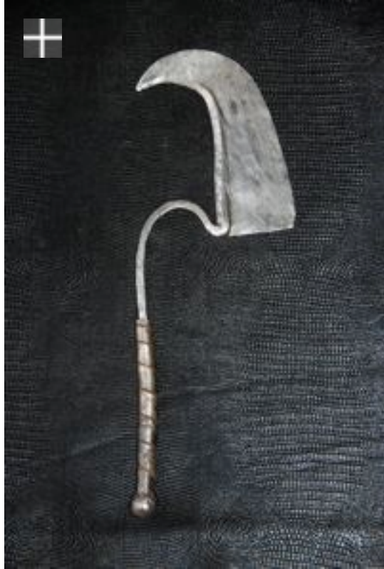
Dadiya 1930/1950 Nigéria