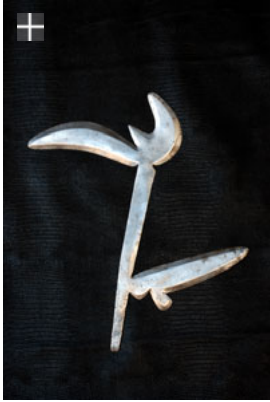
ZANDE - AVUNGARA