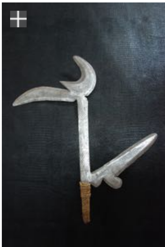
AZANDE - AVUNGARA - 1900