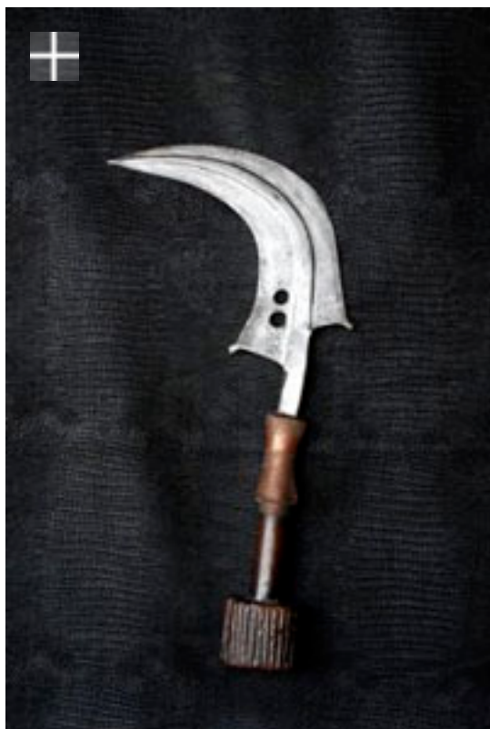
Mangbetu Trumbash 1900 / Congo