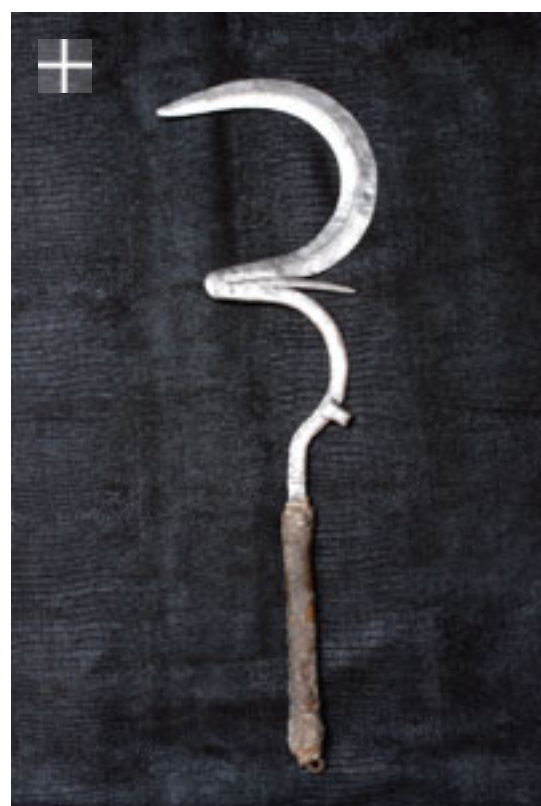
MATAKAM Sengésé / Cameroun