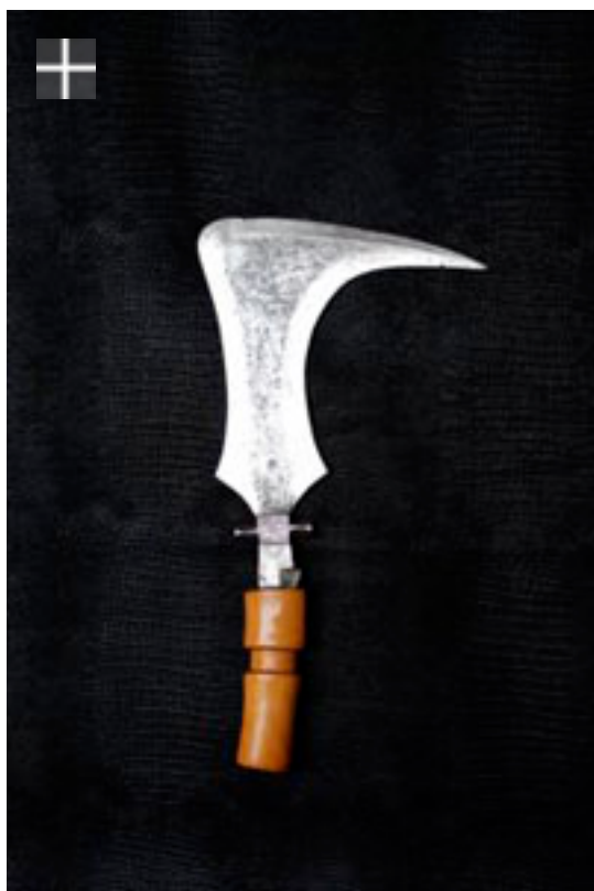
Faucille Budu 1900