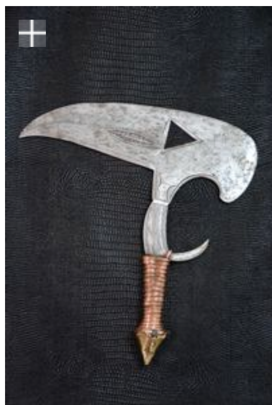
Kota Osele Gabon