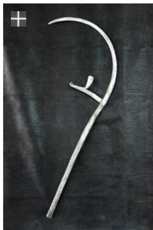
Monnaie sceptre KIRDI-MARGHI