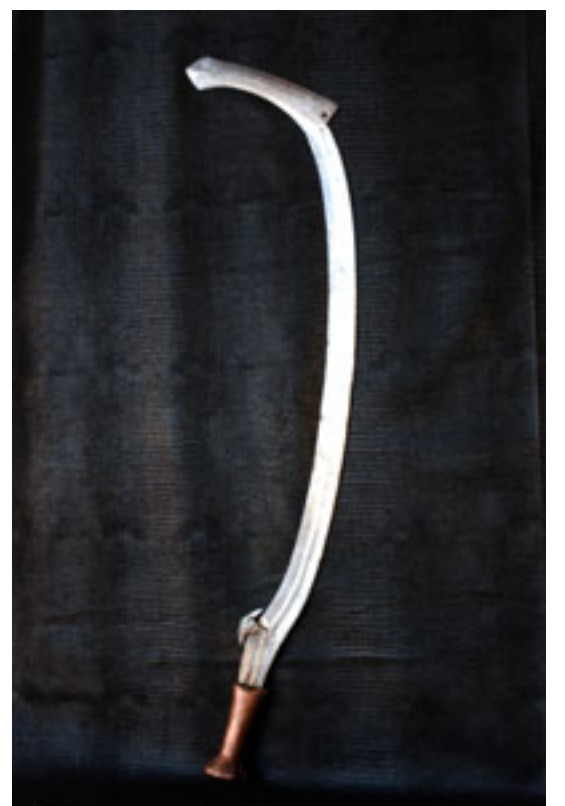
BANDIA - BOA Avant 1900 / Zaïre