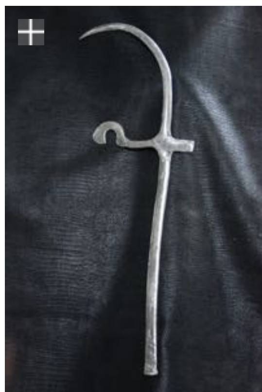
MARGHI-GUDUF Nigéria -Cameroun