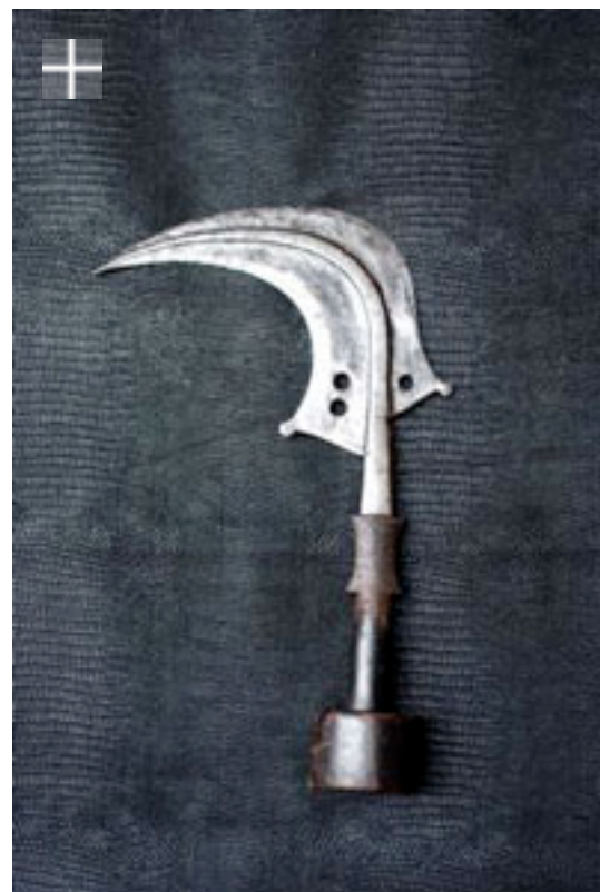
Mangbetu Trumbash 1920 / Congo