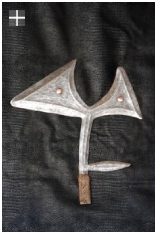
YANGÉRE-GBAYA-NGBAKA 1900 Congo R.D.C.