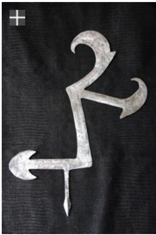
MBUM Hâ Cameroun