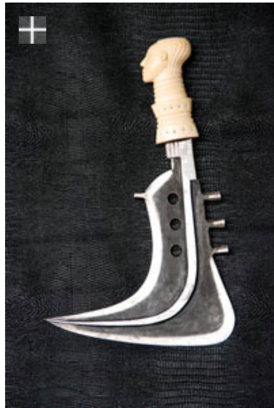
Mangbetu Trumbasch 1940-1950 Congo RDC