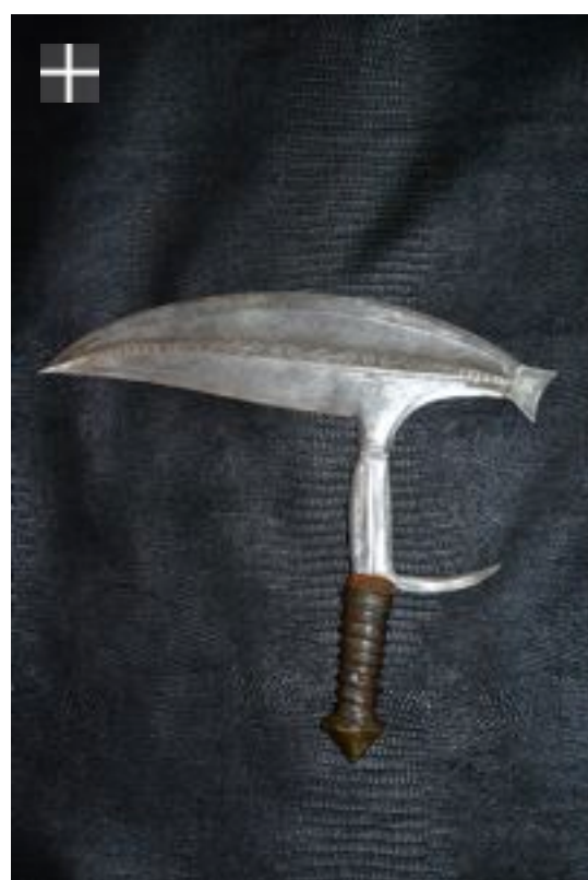
NZABI-Kota Haut Ogooué