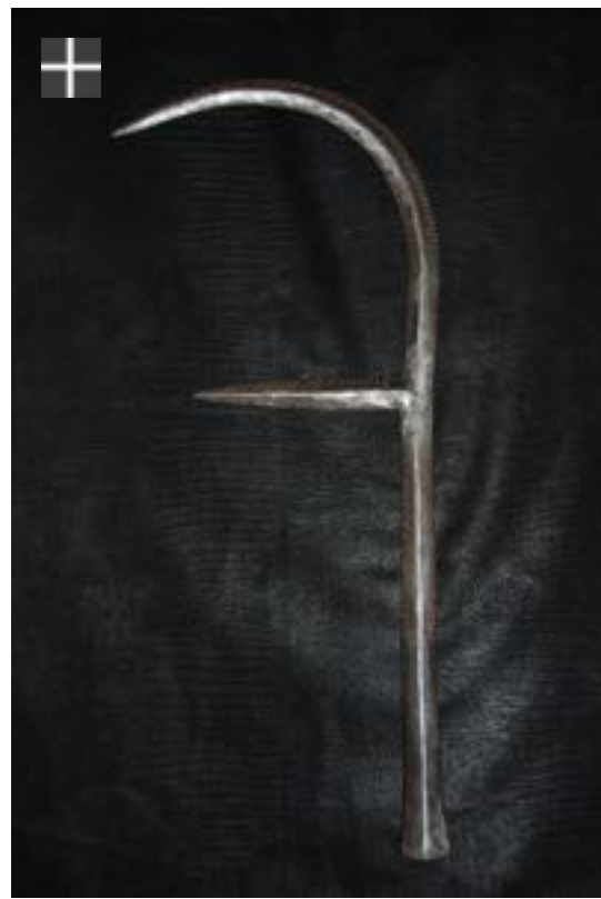
SARA Peuple Kirdi. Tchad 1950