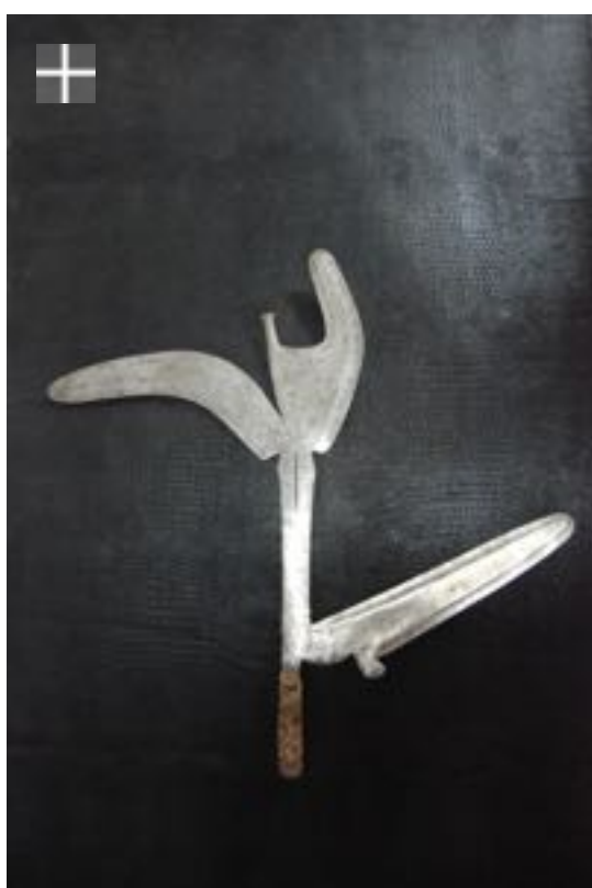
NZAKARA - BANDA