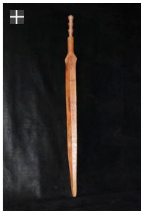
Baton SAKA-MONGO 1900/1920 Congo