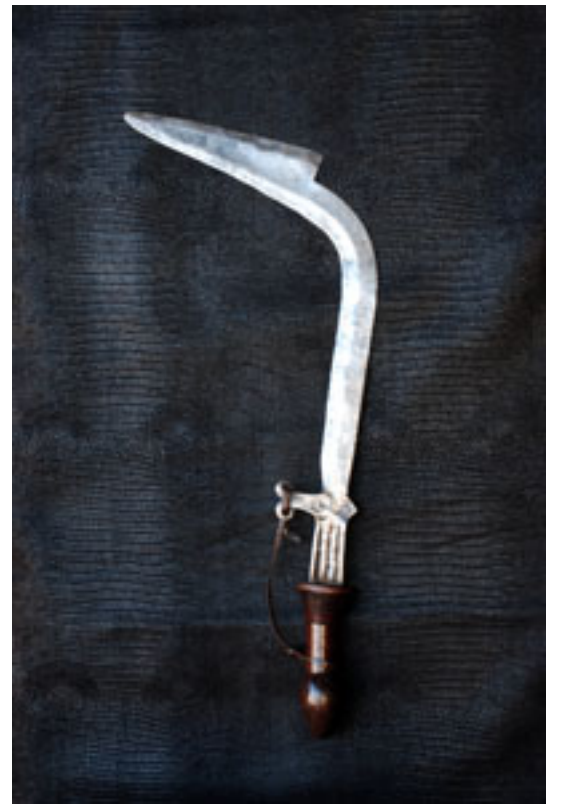
BANDA Avant 1940 / Zaïre