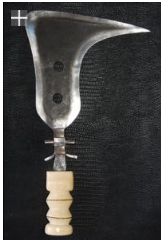
Trumbach Mangbetu 1900/1920