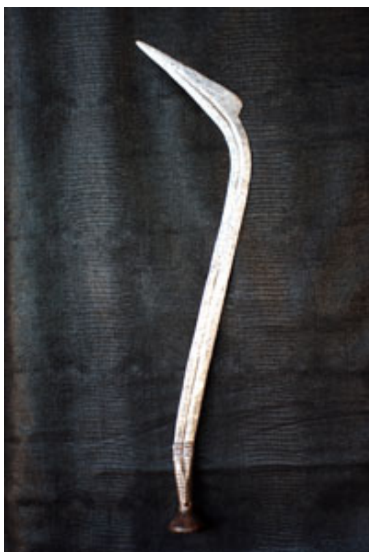
NGOMBE - Doko - Poto avant 1940 Zaïre