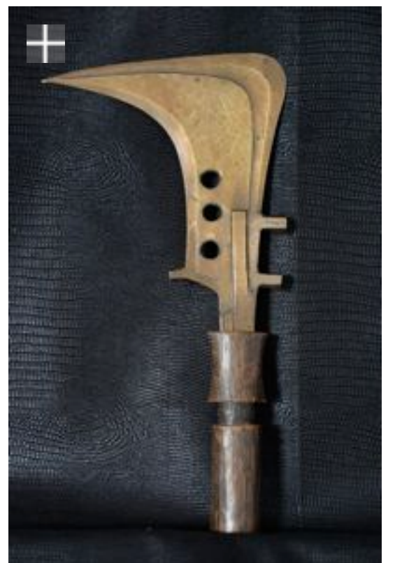
Mangbetu en cuivre. 1900-1920