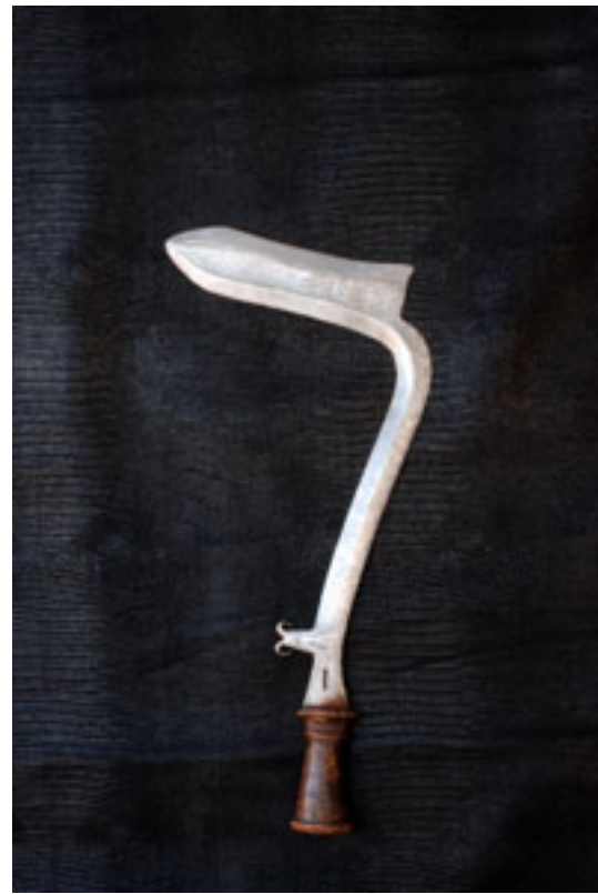
MANZA - BANDA avant 1900 / Zaïre