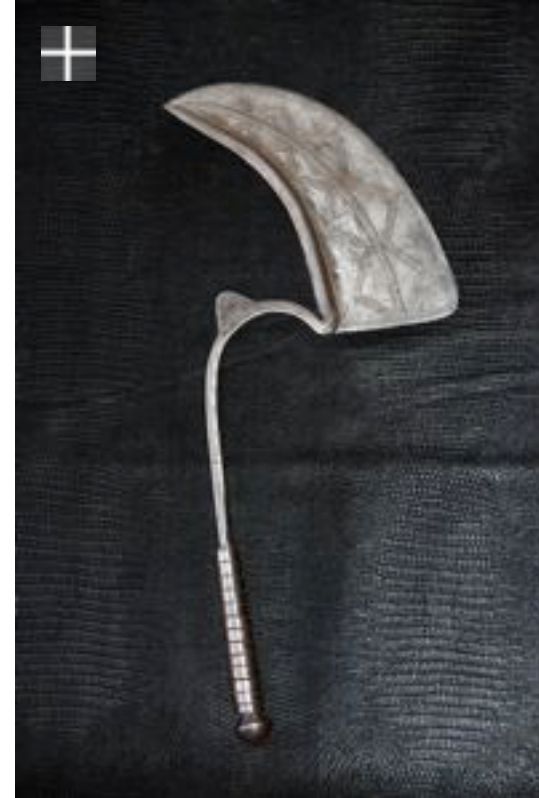
Dadiya Mâle 1940 Nigéria