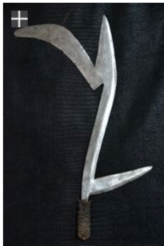
Banda 1900 R. centre Afrique