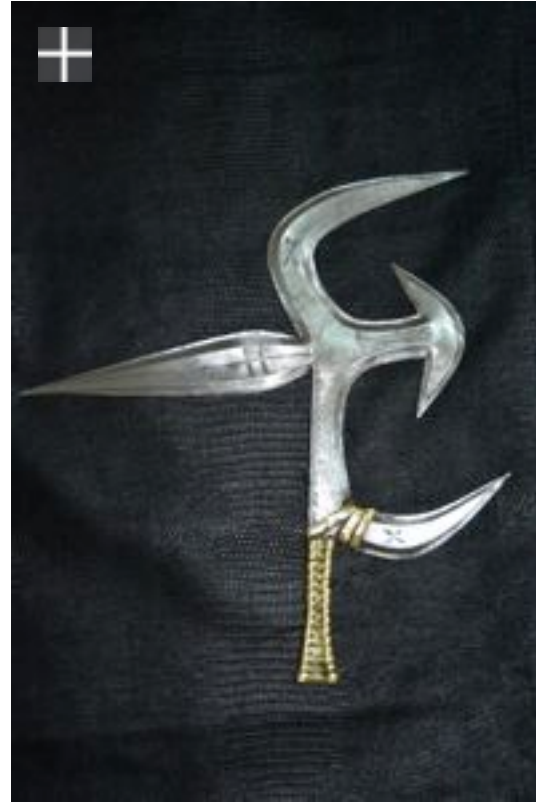
NGBAKA - MABO