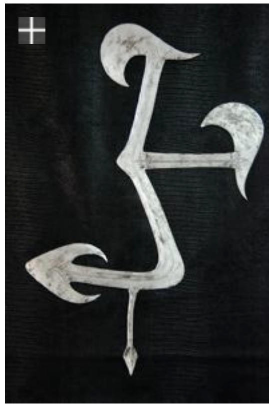
MBUM Cameroun 1960