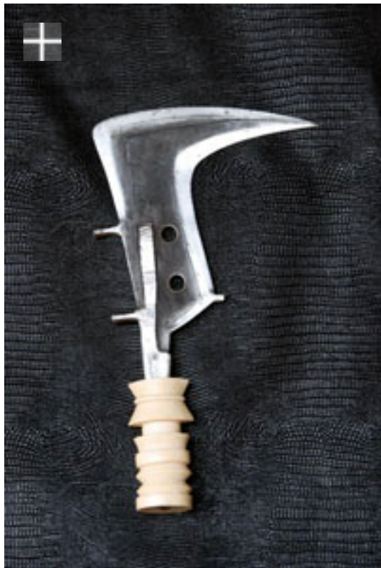
Mangbetu Trumbash 1920 / Congo