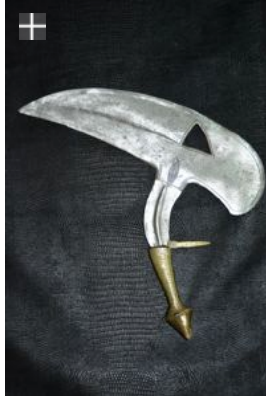
Fang Gabon oselé