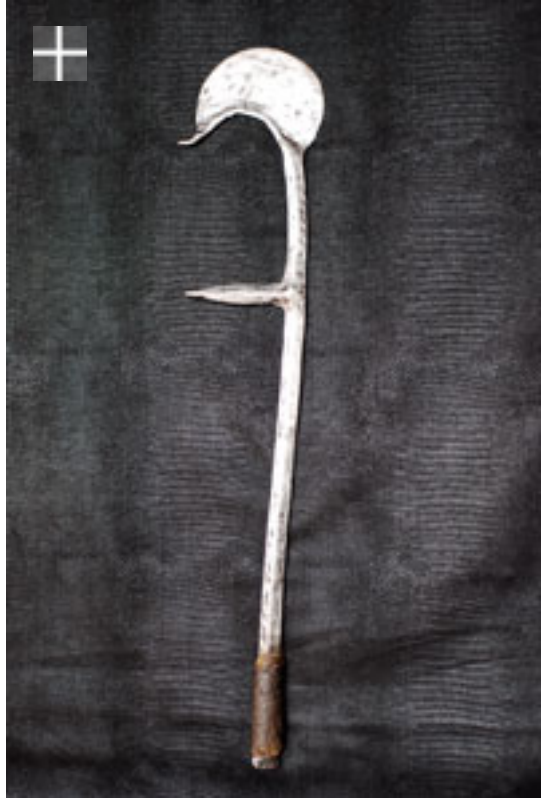
MARGI Mbérembére 1920 / Tchad