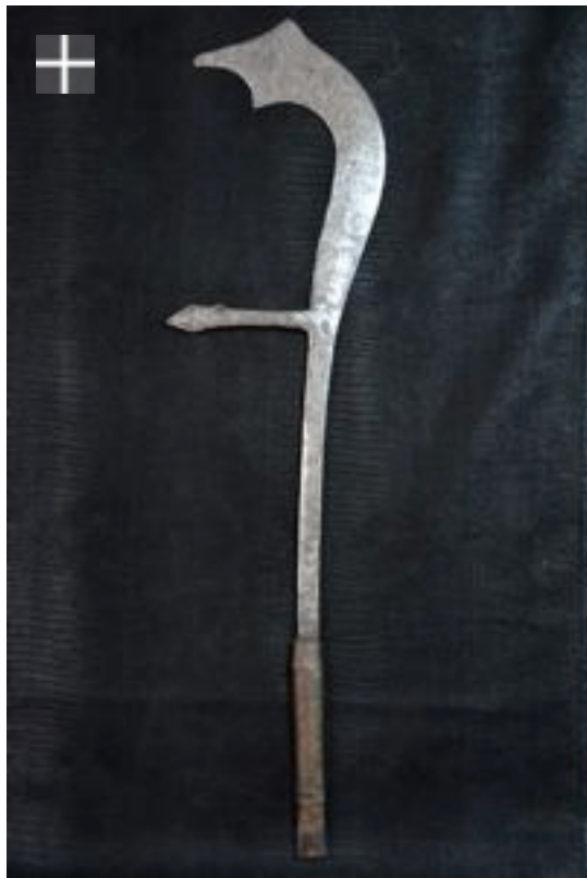
Ingessana "Murder" Scorpion