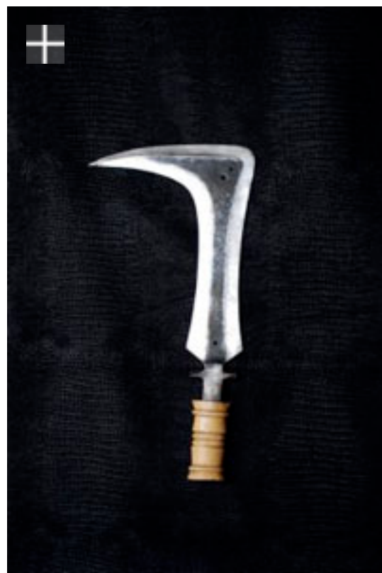
Faucille Budu 1920