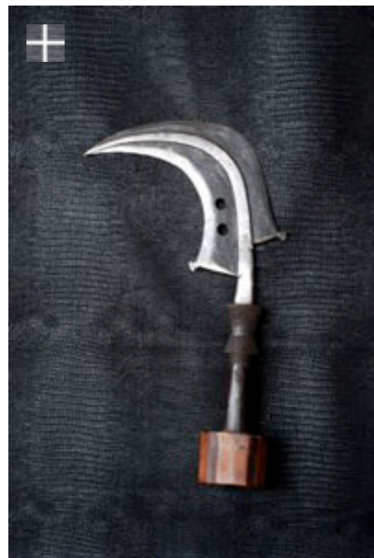
Mangbetu Trumbash 1900-1920