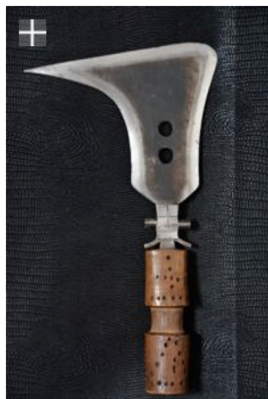
Mangbetu Trumbash 1900-1920