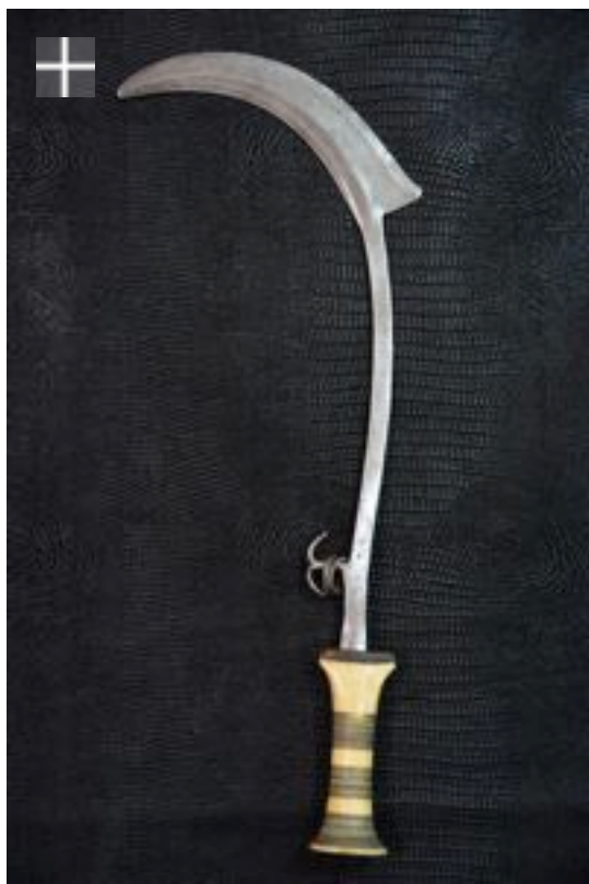
Couteau faucille Kreich-Bongo-Adio-Sere. 1900-1920