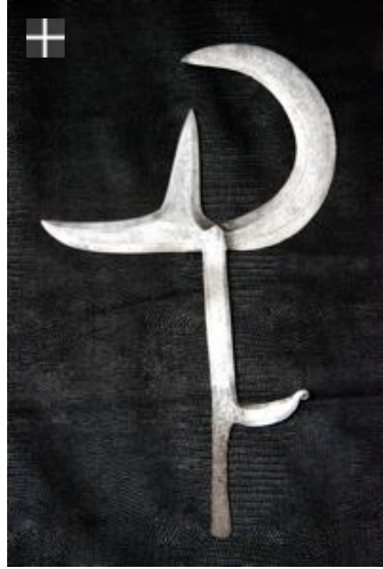
NGOMBÉ - RDC / RCA 1920