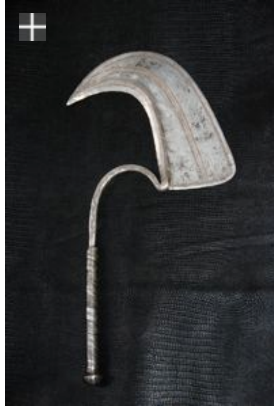
Dadiya 1930/1950 Nigéria