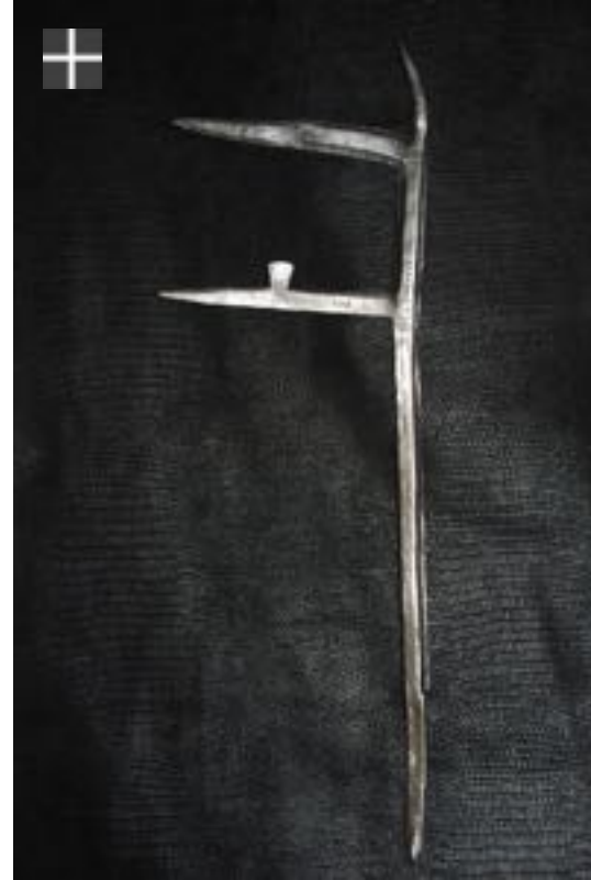
LAKA Ngambaye Tchad