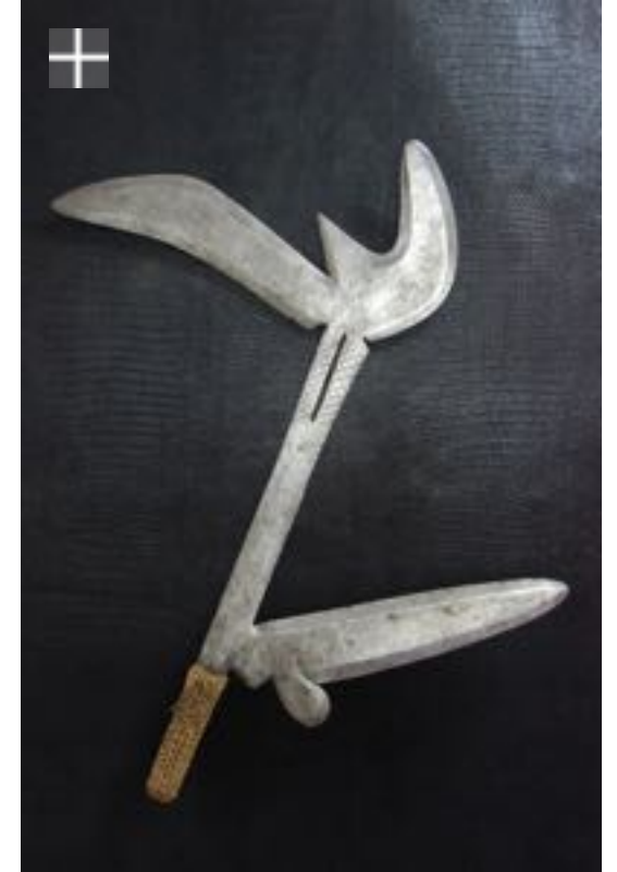
ZANDE - AVUNGARA