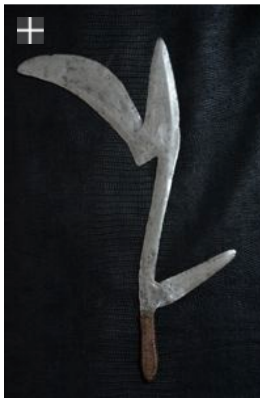
Banda 1880-1900 R.C.A