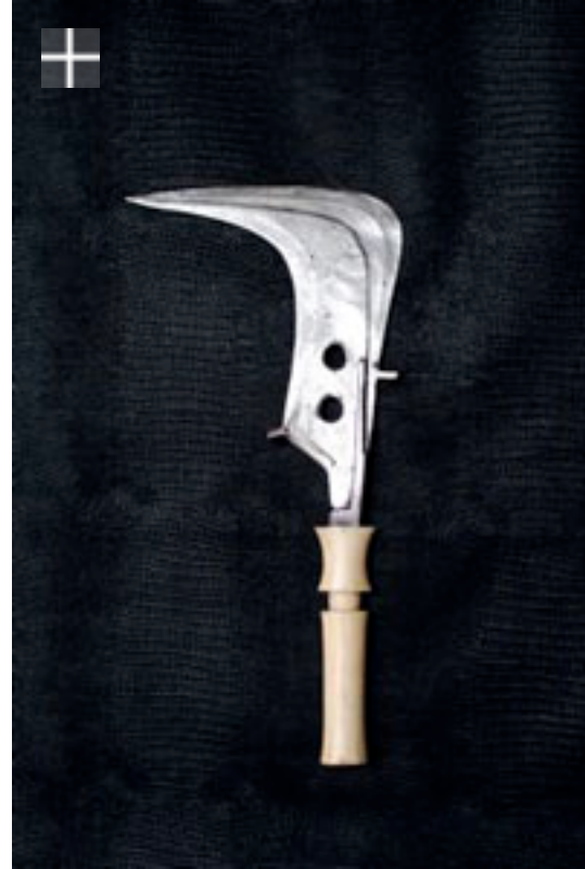
Mangbetu Trumbash 1910-1920 Congo