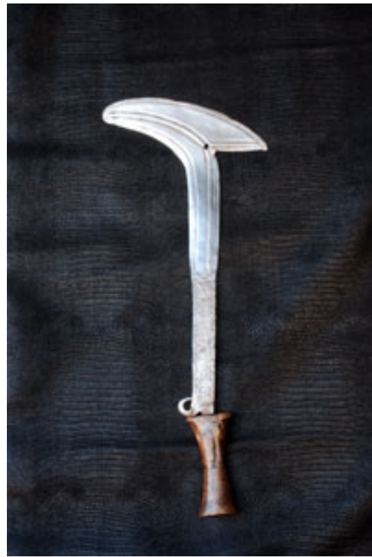
GBAYA Bumali 1930 / Gabon