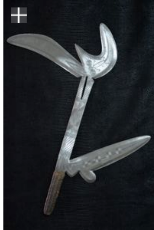
ZANDE - AVUNGARA