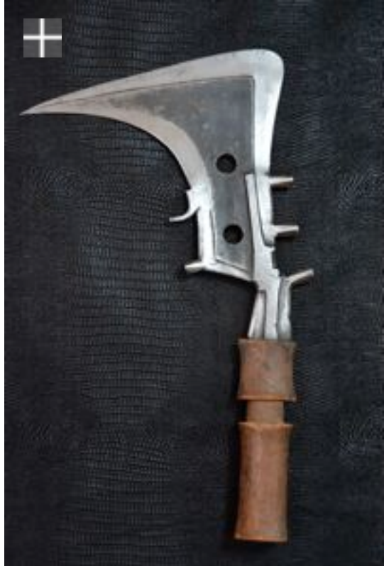
Trumbash décalé Mangbetu