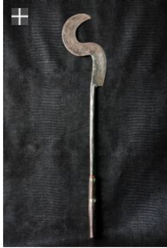
TUTSI-Hutu 1930-1940 ZAÏRE