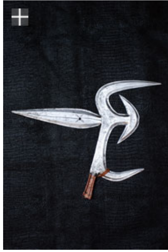
NGBAKA - MABO 1920-1940 Congo R.D.C.