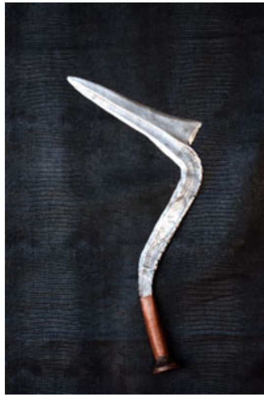
NGBANDI - BERO 1920 / Zaïre