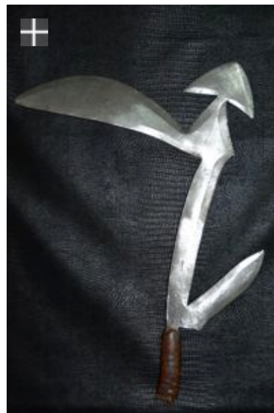
Kreich RCA Soudan