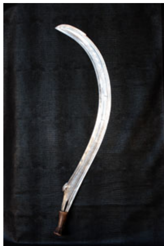
BOA MONGELIMA Avant 1930 / Zaïre