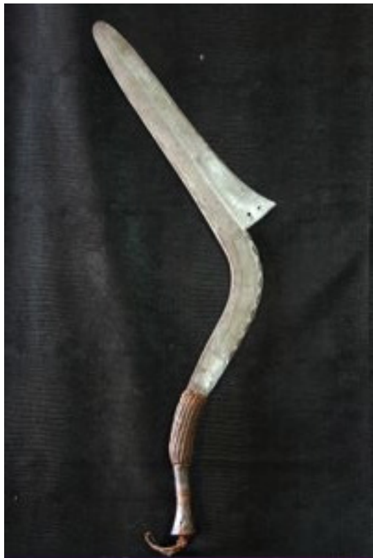
NGANDI-MBUDJA Béro 1890/1920