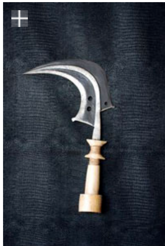
Mangbetu Trumbash 1880-1900 Congo