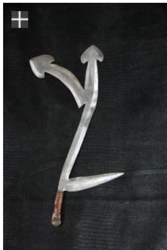
Banda-Nzakara 1900 Oubangui Congo