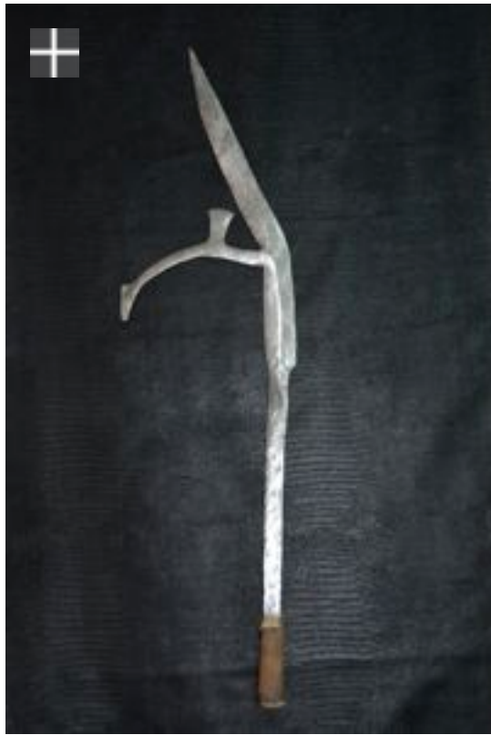
Fur / Darfur Soudan