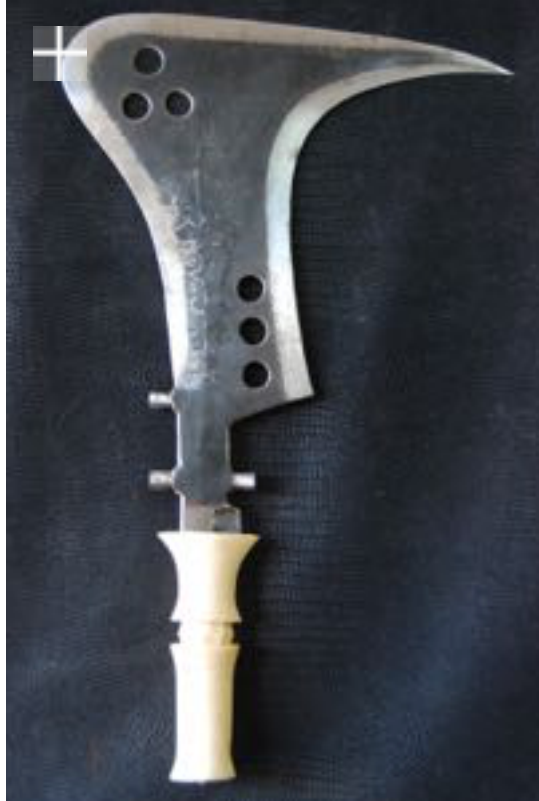
Faucille Mangbetu 1930