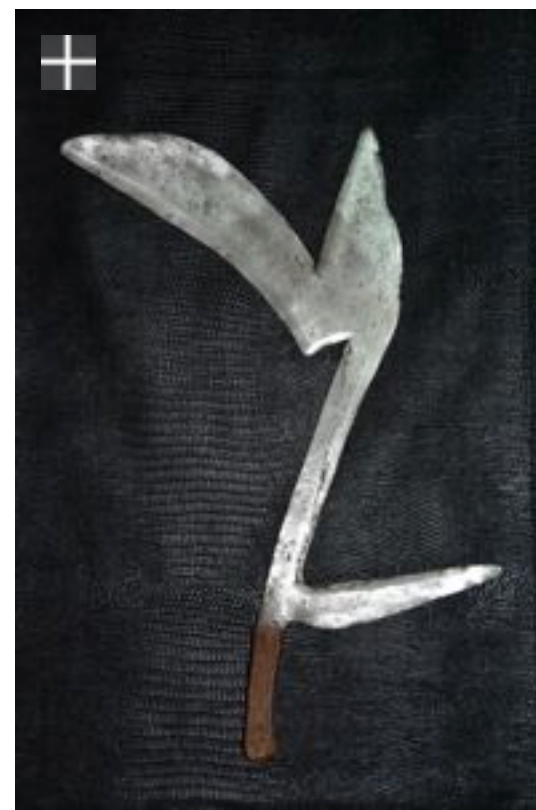
Banda 1880-1920 R.C.A