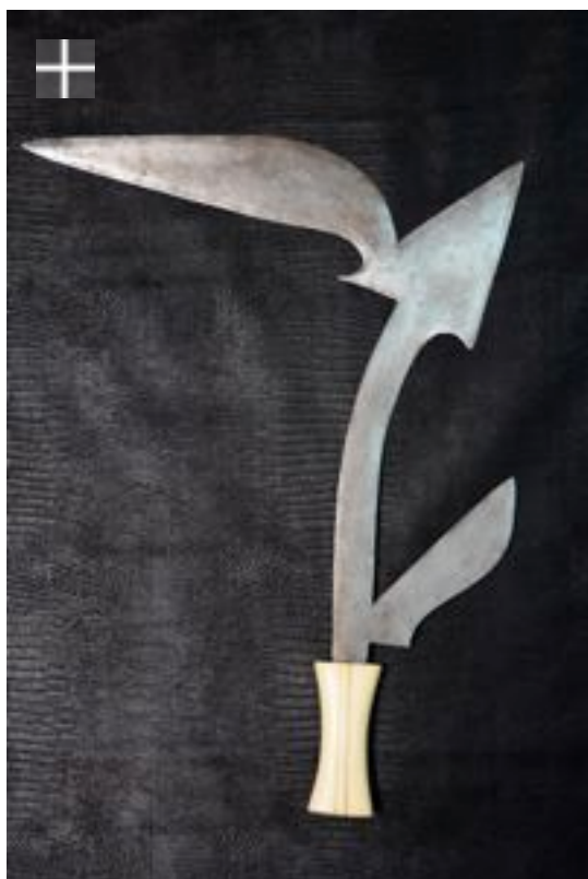
Kreich RCA Soudan