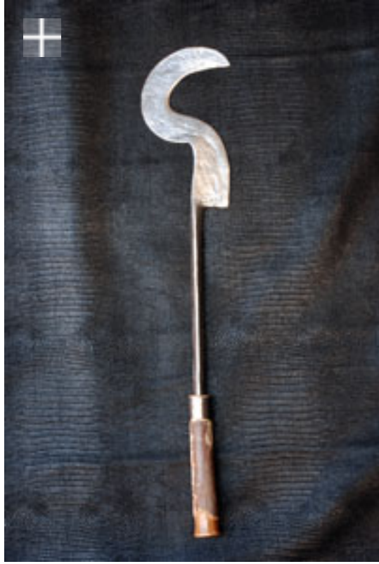
TUTSI - Hutu Avant 1940 / Zaïre