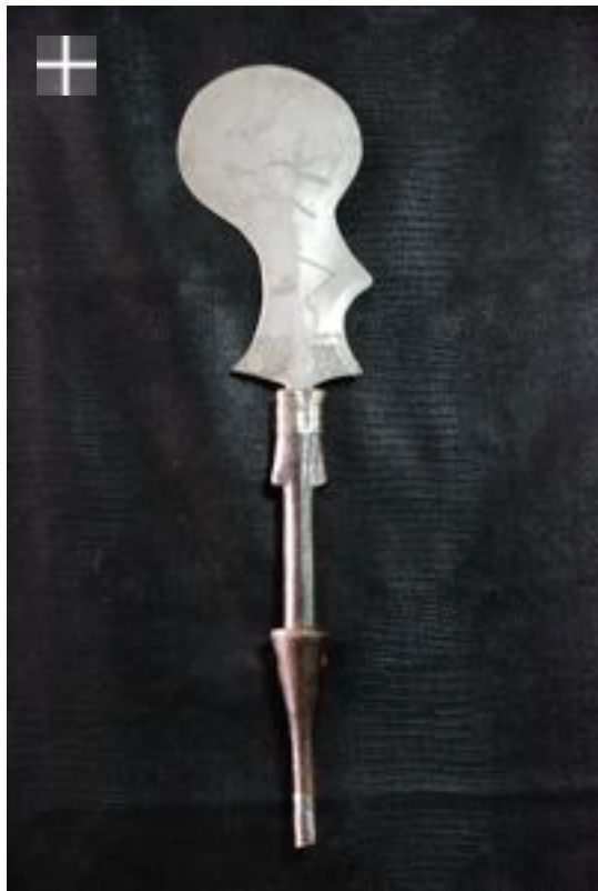
MOMVU-UGGO 1880/1900 Congo