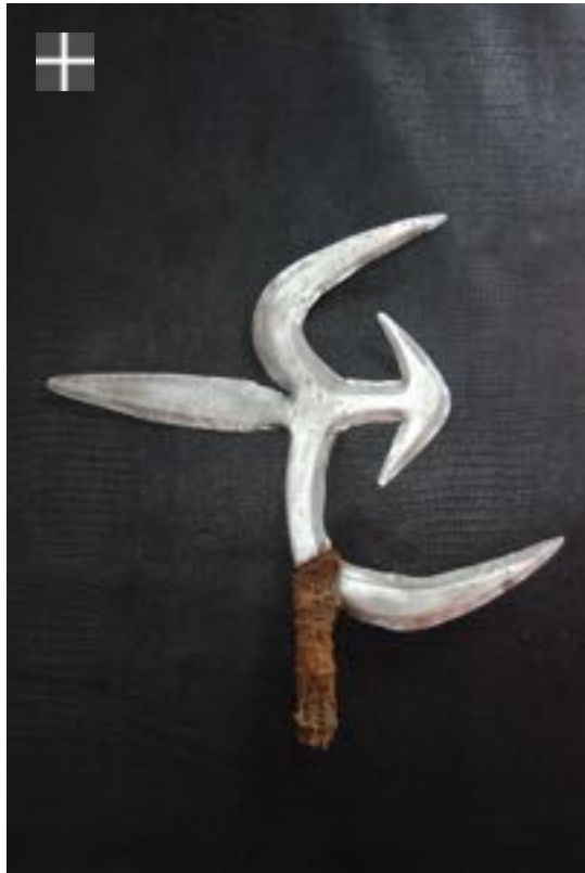
NGBAKA - MABO